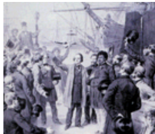
➤ Départ de Victor Hugo en exil